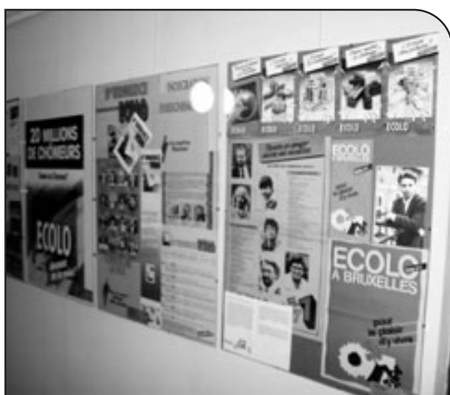
Das ECOLO-Archiv „Etopia“ ließ in einer umfangreichen Ausstellung 30 Jahre ECOLO Revue passieren