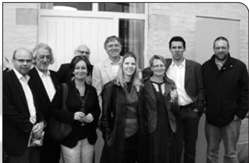
30 Jahre ECOLO – Ein Grund zum Feiern

Mitteilungsblatt der ECOLO-Bewegung in Ostbelgien