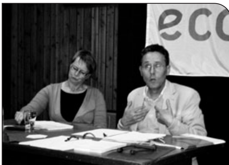
Der renommierte Wirtschaftswissenschaftler Pierre Reman referierte auf Einladung von ECOLO zum Thema Soziale Sicherheit.

Unabhängig von der Regionalisierung ist der demographische Wandel die große Herausforderung für die Soziale Sicherheit, dem Belgien bisher noch kein schlüssiges Konzept entgegengestellt hat. Prinzipiell muss über einen anderen Finanzierungsschlüssel des Systems nachgedacht werden, welches derzeit zu 65% aus